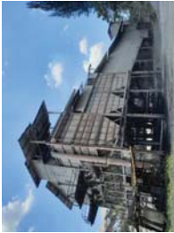
โรงเรือนของโครงการ