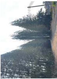
แนวต้นไม้ภายในโครงการ