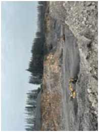
หน้าเหมืองปัจจุบัน